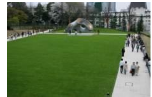
東京ミッドタウン 芝生広場

平野治朗《GINGA》2003年 越後妻有アートトリエンナーレ 2003 (新潟)