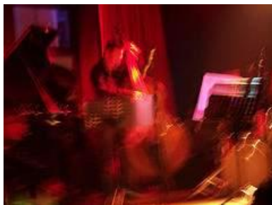
JAZZ パフォーマンスイメージ

※なお、「Tokyo Midtown ART BOX」で上映する映像は、東京ミッドタウンに設置している映像モニターでも期間中にご覧いただけます。