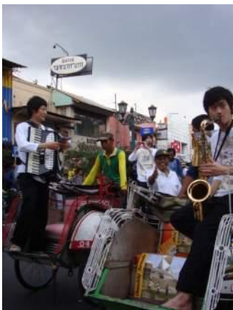
チャンチキトルネード ジョグジャカルタ・マリオポロ市場通りパレード (インドネシア) 2008年