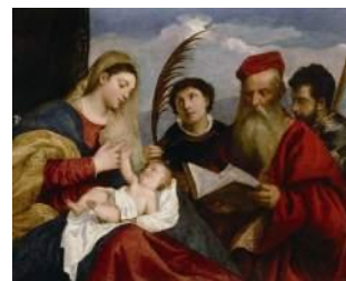
ティツィアーノ 《聖母子と聖ステパノ、聖ヒエロニムス、聖マウリティウス》1517年頃 油彩、カンヴァス