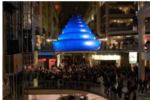
藤原隆洋 《into the blue》2008年 協力: トロント市、稲畑ファインテック株式会社 展示風景: 「ヌイ・ブロンシュ」トロント・イトンセンター (カナダ)