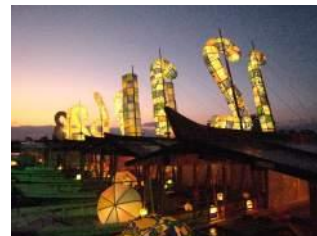
日比野克彦 《こよみのよぶね》2006年 展示風景: 長良川河畔 (岐阜)