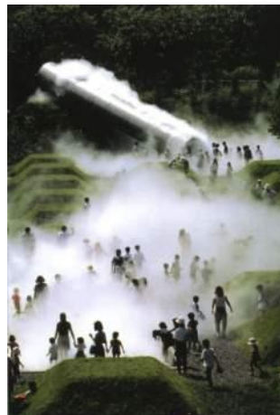
中谷芙二子 《霧の森》1992年 設計協力: 北川原温+ILCD、森岡侑士、高谷史郎 総合計画: 高野ランドスケーププランニング 展示風景: 昭和記念公園園子の森 (東京)