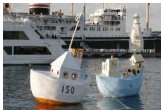
日比野克彦 《THE SEED TRIP「種は船」造船プロジェクト》 2008年