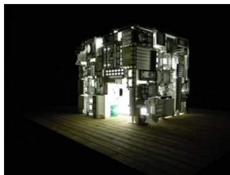
開発好明 《発泡苑イン・ウィンタートゥア》2006年 展示風景: ウィンタートゥア市 (スイス)

※上記はアーティストのこれまでの作品であり、六本木アートナイトでの出展作品とは異なるものもあります。