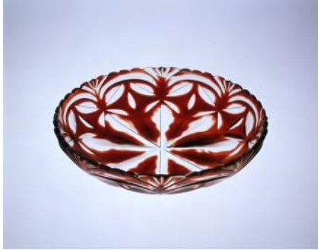
薩摩切子 紅色被皿