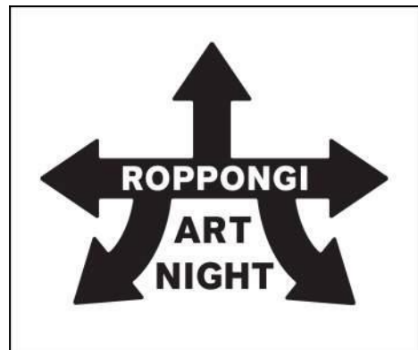
六本木アートナイト公式ロゴ

アートの力がどこまで街を変えることができるのか。六本木がアートで変わる驚きと感動の一夜を多くの皆様に体験いただき、アートの持つ力やその可能性を体感していただきたいと考えています。