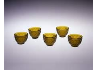
薩摩切子 黄色小鉢