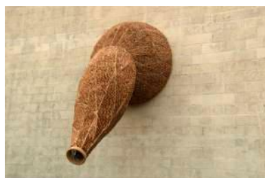
大平貴 《サンタ・アナの風》 2007年