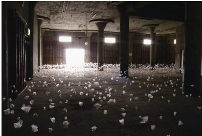
丸山純子《無音花畑》2007年 BankArt1929 (横浜)