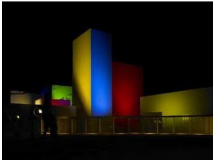
高橋匡太 《いるとどりのかけら》2008年 十和田市現代美術館 (青森)