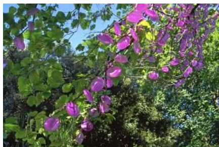
平川滋子 《光合成の木》 2006年 (市庁舎公園、フランス、アルジャントウイユ市)