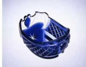
薩摩切子 藍色被船形鉢