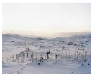
石川直樹 《Graveyard/Iluissat》 2006年