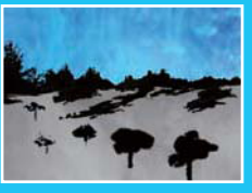
リンダ・チハロワール《現象風景》2011年