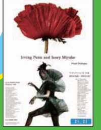
展覧会ポスター (写真上)「Poppy:Glowing Embers」、ニューヨーク、1968年 (下)「Flower Pleats(Issey Miyake Design)」、ニューヨーク、1990年