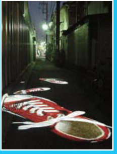
志村信裕《赤い鯉》2009年

各国のアーティスト7名によるユニークな映像作品を上映 24日(土) 10:00~25日(日) 18:00まで断続的に上映