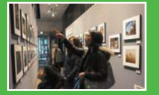
作品展示風景の様子

一般公募による「六本木の素顔」の写真の中から、入選作品を展示 東京ミッドタウン内 フジフィルムスクエア