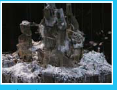
イ・ブル《ブルーノ・タウトに倣って (物事の甘きを自覚せよ)》2007年