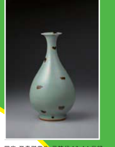
国宝 飛青磁花生 元時代 13-14世紀 大阪市立東洋陶磁美術館蔵 (住友グループ寄贈/安宅コレクション)