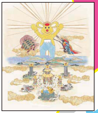
Antenna 《六本木伝承 2012》2012年

六本木の街中を舞台に、3人のウォーキングアクターが登場し、六本木アートナイトを盛り上げます。六本木のストリートに神出鬼没するアクターとの出会いをお楽しみください。 展開場所：六本木内各所