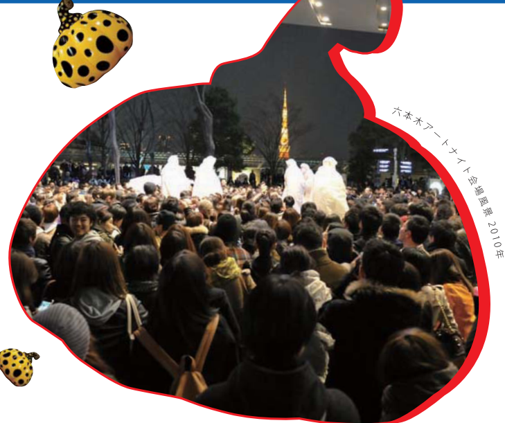
六本木アートナイト会場開演2010年