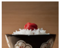
佐藤卓デザイン事務所「いけたまます」

私たちの文化の根幹をなすコメのありようを新鮮な目で見つめ直し、 その未来像を考察します。