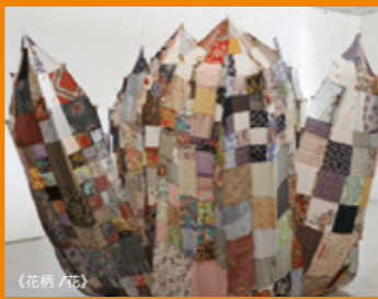
《花柄 / 花》