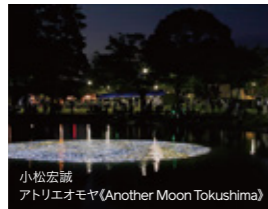
小松宏誠 アトリエオモヤ(Another Moon Tokushima)

気鋭の作家による 大型インスタレーション 気鋭アーティストによる作品が、 見慣れた風景を一変させる! 参加予定作家：八谷和彦、 小松宏誠、SHIMURAbros 他