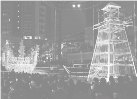
六本木アートナイト 2013の会場風景

「六本木アートナイト」は、六本木の街を舞台とした一夜限りのアートの祭典。美術館をはじめとする文化施設、大型複合施設、商店街が集積する六本木の街全域にわたり、アート展示、音楽やパフォーマンス、トークなどのイベントが開催されるほか、美術館の開館時間延長や入場料割引、様々なショップでのサービスなどが実施されます。今年にはアーティストックディレクター日比野克彦氏監修のもと『動け、カラダ!』をテーマに「アートの持つ身体性」に目を向け、アート作品の展示はもちろん参加型パレードや体験型アート、パフォーマンス、フードプログラムなどのコンテンツを街中に登場させます。ぜひご期待ください!