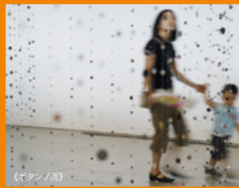
《ポタン / 雨》

六本木ヒルズ、東京ミッドタウン、国立新美術館には、古着を再利用して制作された西尾美也による巨大なパッチワーク作品が出現。[3/15、16両日は一般から参加者を募集し、ワークショップを行います。詳細は公式ウェブサイトをご覧ください。]