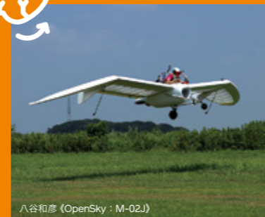
八谷和彦 (OpenSky : M-02J)