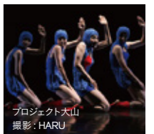
プロジェクト大山