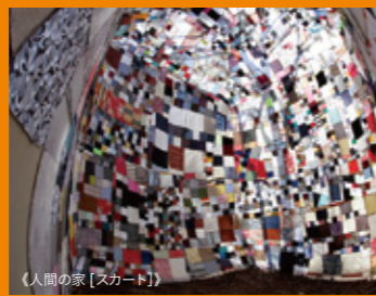
《人間の家 [スカート]》