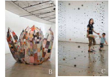
A:《人間の家[家]》2010年 撮影:齋藤剛 B:《花柄／花》2011年 撮影:下道基行 C:《ボタン／雨》2011年 撮影:下道基行