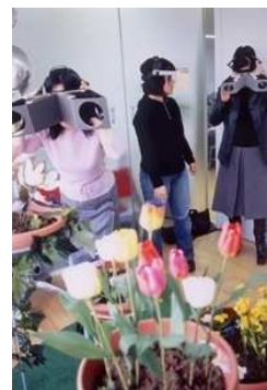
「ガリバースコープ」を使った ワークショップの様子 《クリニック》