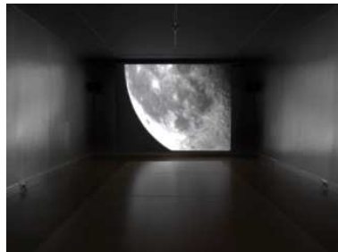
篠田太郎《月面反射通信技術》 2007年～