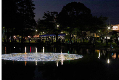
小松宏誠 図版: アトリエオモヤ《Another Moon Tokushima》