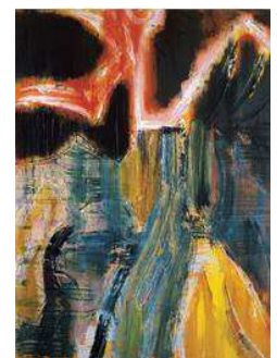
《存在の鳥 107(キジ)》2006年 アクリリック/綿布 260.1×190.8 cm 東京国立近代美術館蔵

<一般の方からのお問い合わせ先> 国立新美術館(住所:東京都港区六本木7-22-2) TEL:03-5777-8600(ハローダイヤル) http://www.nact.jp/