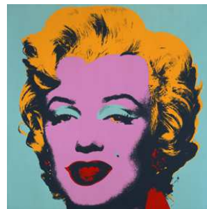
アンディ・ウォーホル 《マリリン・モンロー(マリリン)》 1967 年 紙にスクリーンプリント 91.4 x 91.4 cm アンディ・ウォーホル美術館蔵 © 2014 The Andy Warhol Foundation for the Visual Arts, Inc. / Artists Rights Society (ARS), New York Marilyn Monroe™; Rights of Publicity and Persona Rights: The Estate of Marilyn Monroe, LLC marilynmonroe.com