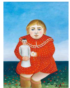
アンリ・ルソー 《人形を抱く子ども》 1904-05年頃 オランジュリー美術館