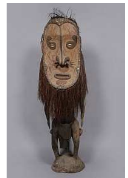
神像付きの椅子 民族:イアトムル 国名:バブアニューギニア 1988年収集 国立民族学博物館蔵