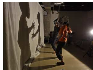
《光と影のワークショップ》