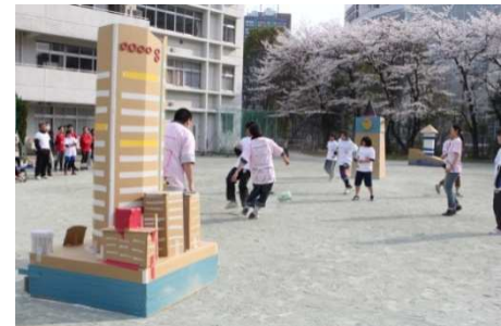
昨年の《ヒビノカップ in 六本木》の様子