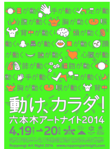
六本木アートナイト2014メインビジュアル