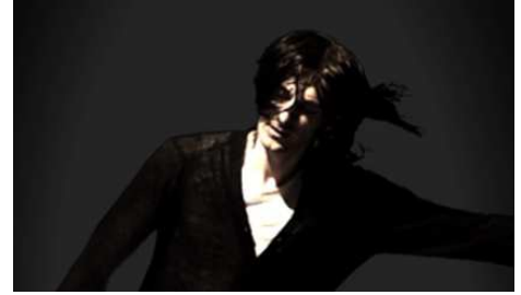
SHIMURAbros 《EICON / SLAPSTICK》