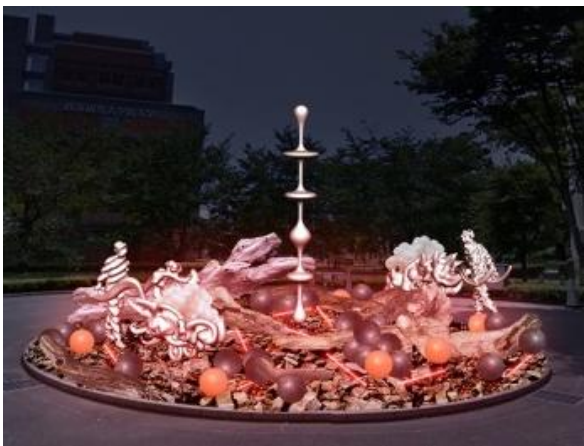
国立新美術館での展開イメージ

東京ミッドタウンでは、サボテンなどの多肉植物がバルーンオブジェに包まれて点在します。それらはまるで、バルーンの繭によって植物の生育を補助し再生を促す孵化装置のようでもあり、保育器(インキュベーター)で生気を取り戻すために、しばしの眠りにつく、小さくて未成熟な森の精霊達の安息地とも言えます。