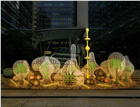
東京ミッドタウンでの展開イメージ