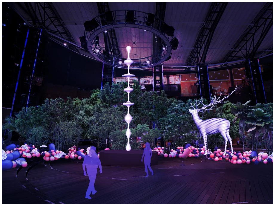
六本木ヒルズアリーナでの展開イメージ

六本木ヒルズアリーナでは、西畠が世界各国から集めた多種多様な樹木によって、成熟した森が構成されます。そこでは名和の彫刻作品「Ether」と「White Deer」が会うシーンが表現されます。「White Deer」は、岡山県の犬島で誕生し京都に立ち寄り、東京を彷徨い森のなかで「Ether」と出会います。その後、東北へと向かい、宮城県の牡鹿半島で来年開催される「Reborn-Art Festival 2017」で展示する予定です。また、六本木ヒルズアリーナには、石巻の漁で使用されているブイも配置され、都心の成熟した森に浮遊する海の物が混在する、幻想的な光景が出現します。