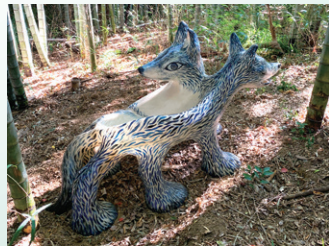
《狼ベンチ》2022年 W1.9×D0.8×H1.1m FRP、水性塗料