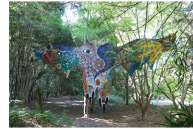
《高松→越前→静岡→六本木皮トンビ》2022年 約W12×H5.5m 牛革、水性塗料、クレヨン

絵画、彫刻、パフォーマンスなど様々なメディアと、旅によるサイトスペシフィックな表現で芸術の根源的な問い直しを続ける鴻池朋子。屋外展示で話題を呼んだ《皮トンビ》が日本を横断しながら東京ミッドタウンに降り立ちます。