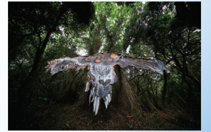
《大島皮トンビ》2019年 約W12×H4m 牛革、水性塗料、クレヨン