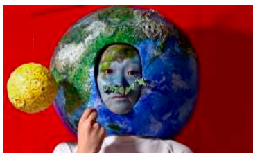
《もうないかもしれないよ》

この世界は、想像しつづけることで存在しています。本展の2つの映像作品は、それぞれ、地球が人間視点による無数の事実を語る《もうないかもしれないよ》と、生命の生と死が愉快な悪夢のように循環する《踊るブッダの誕生日》です。あらゆる生命は、同じ世界に存在しているようで、異なる世界を生きています。本展は、無数の事実と生と死という掛け合わせから、見えるものと見えざるものが繋がる世界を立ち上げます。