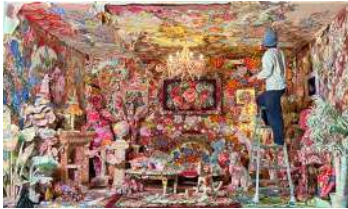
毛布で覆われた空間を製作中