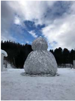
雪だるまのヌケガラ