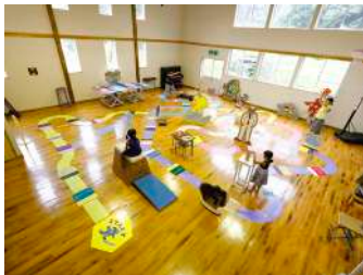
《妻有双六》 2021年