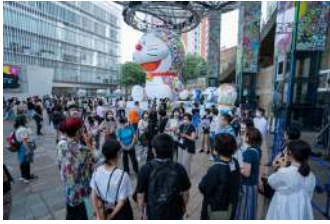
©Takashi Murakami/Kaikai Kiki Co., Ltd. All Rights Reserved. ©Fujiko-Pro

六本木アートナイトをさまざまな人たちともに巡る鑑賞ツアーを開催します。参加者同士対話しながら、作品鑑賞を楽しみましょう。