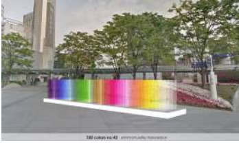
エマニュエル・ムホー 100 colors no.43「100色の記憶」、2023年（イメージ）