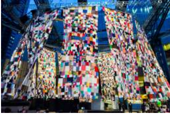
西尾美也《カラダひとつ：人間の家[スカート]》2014年 展示風景：「六本木アートナイト2014」2014年／ 六本木ヒルズアリーナ／東京