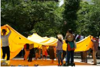
西尾美也《着がえる公園》2019年 展示風景：「六本木アートナイト2019」／三河台公園／東京