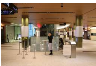
35° 39'55"Nの旅 2022年