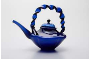
藍色ちろり 日本 18世紀 サントリー美術館 【全期間展示】