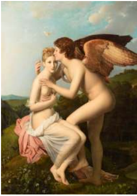
フランソワ・ジェラルール《アモルとプシュケ》、または《アモルの最初のキスを受けるプシュケ》 1798年、油彩／カンヴァス、186 x 132 cm