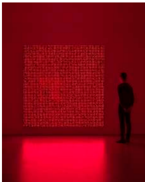
宮島達男 《Innumerable Life/Buddha CCICJ-01》 2018年 所蔵：森美術館（東京）