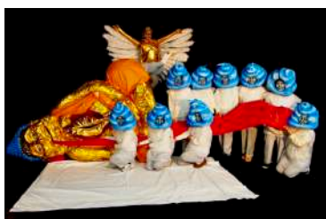
《踊るブッダの誕生日》