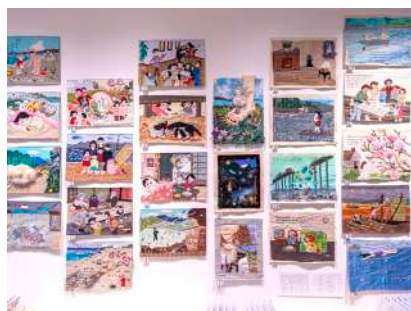
《物語るテーブルランナー》

© 2021 Tomoko Konoike Courtesy of Kadokawa Culture Museum