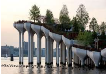
ヘザウィック・スタジオ《リトル・アイランド》 2021年 ニューヨーク