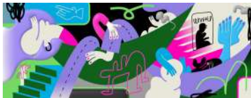
“SEEK and FIND” イメージ