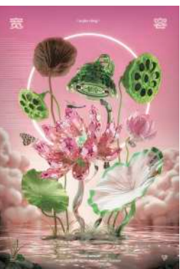
San Jin(中国)によるデザイン