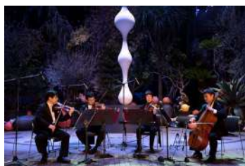
クラシックなラジオ体操