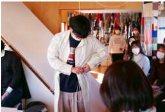
西尾研究室「DATSUEBA奈良」におけるワークショップの様子、2022年