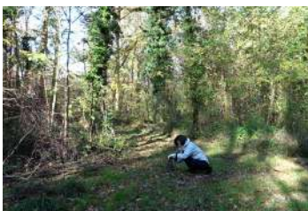
しばたみづき《Make As Like A Pot》2016年 セナールの森/フランス