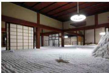
小海の半島の旧家の大海