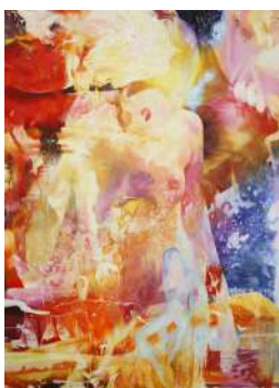
"/ 72" 2017 oil on canvas 2273x1620(mm)