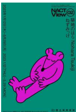
「NACT View 02 築地のはら ねずみっけ」 フライヤー画像 © Nohara Tsukiji