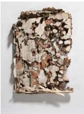
book (ing) No.12