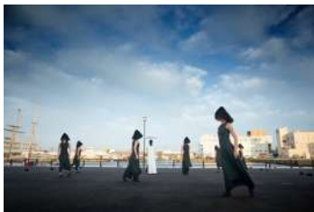
Noism2特別公演2018『ソーン』