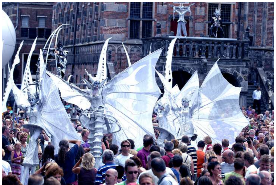
Close-Act Theatre (White Wings)

「六本木アートナイト2023」では、メインプログラム・アーティストを含め、気鋭のアーティストら約45組による約70のプログラムを展開します。なかでも国際的パフォーマンスカンパニーClose-Act Theatre(クローズアクトシアター)による《White Wings(ホワイトウイングス)》は、リアル開催ならではの体感型プログラムとなり、巨大な白い翼を纏ったキャラクターたちが、音楽と光の演出とともにダイナミックなパフォーマンスを六本木各所で繰り広げます。