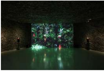
《熱帯複眼》動物故事系列 シングルチャンネル映像、4K、カラー、サウンド 12.2 2020年～2022年 16分